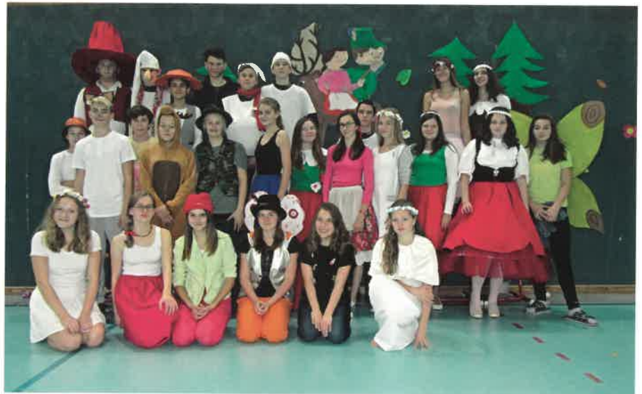
Karneval ZŠ Sobotka – téma – Pohádky Václava Čtvrtka