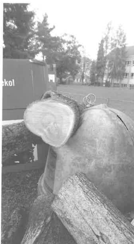
Spadlá lípa a zničené kontejnery na odpad